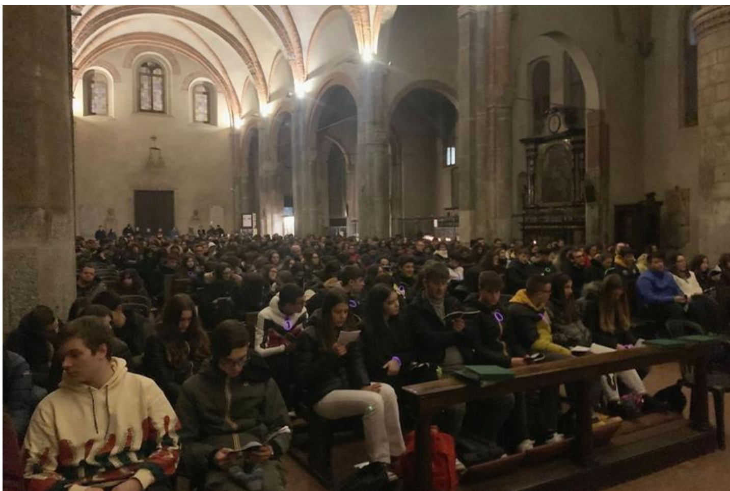
I ragazzi raccolti durante la veglia dopo il «viaggio» attraverso le vie di Milano