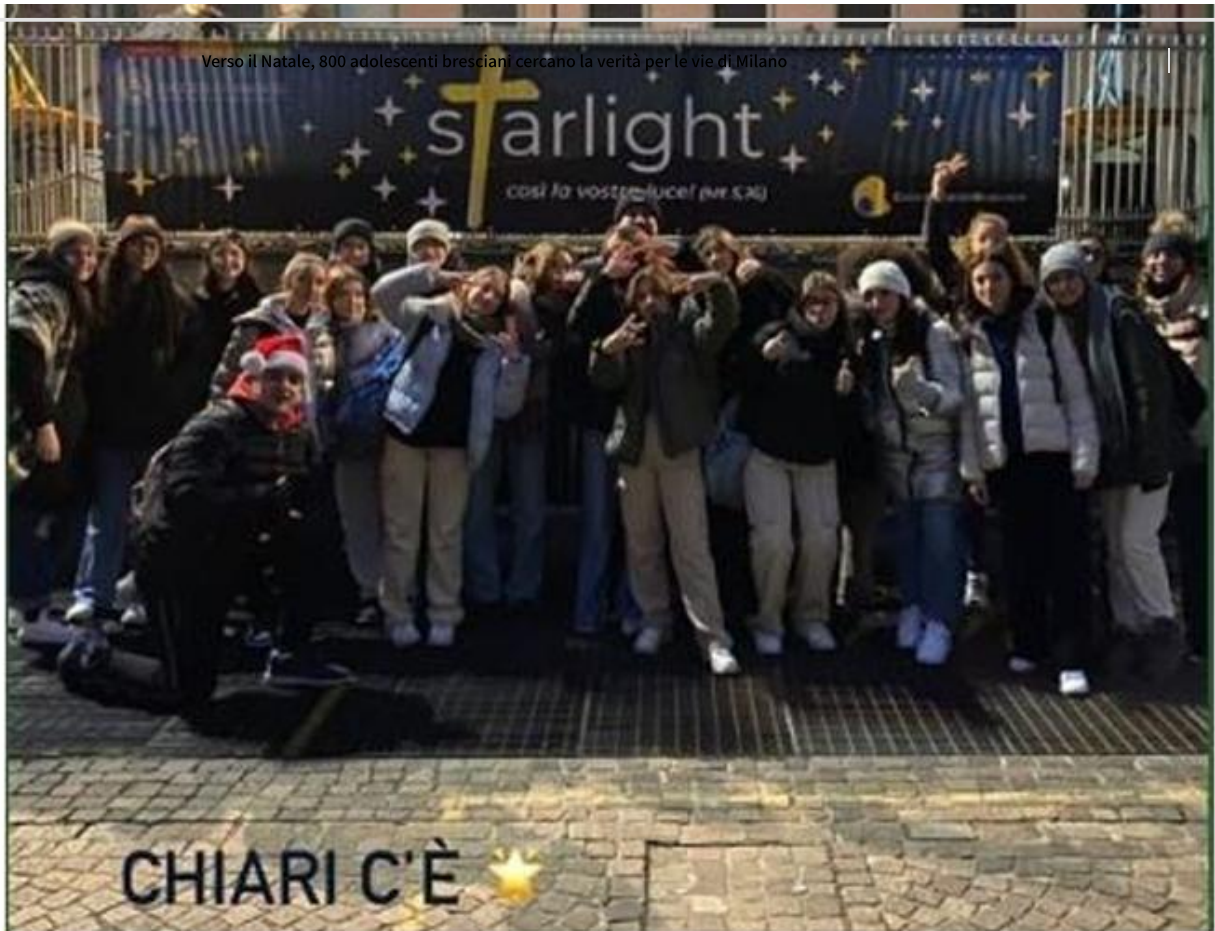
I ragazzi dell'oratorio di Chiari in una foto ricordo postata su Instagram