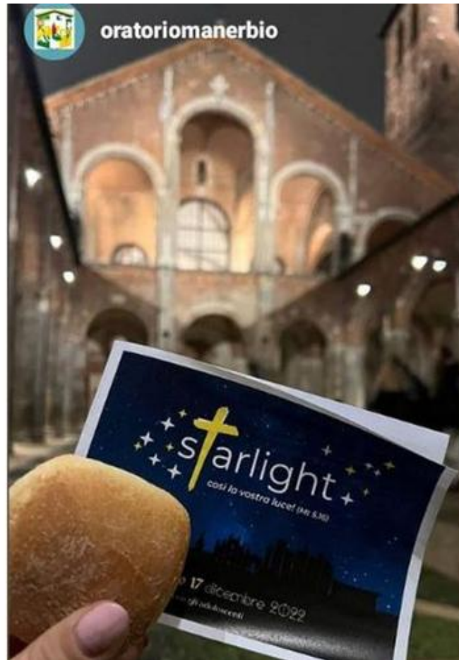
La Basilica di Sant'Ambrogio, tra le tappe, in una storia pubblicata su Instagram dall'oratorio di Manerbio

I ragazzi, provenienti da 60 parrocchie bresciane , dopo un momento di accoglienza nel cortile dell' oratorio di S. Agostino (via Melchiorre Gioia) alle 18, con i saluti del vicario generale mons. Gaetano Fontana , di don Stefano Guidi (direttore della Fondazione Oratori Milanesi), hanno raggiunto la prima tappa del percorso: un balzo « dall'antico al nuovo » verso la modernissima piazza Gae Aulenti .